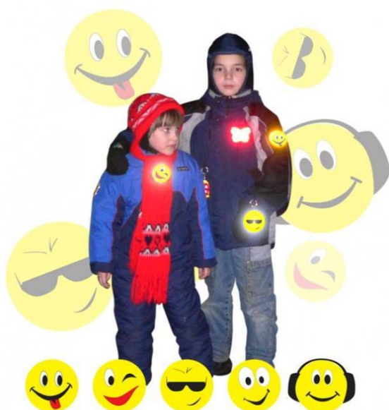
Световозвращающие значки ЗМ